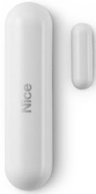
Nice Door/Window Control